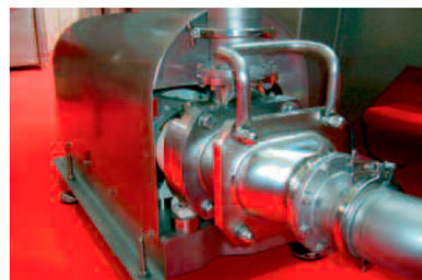
■ Pumpning af kød til pølse / Sausage meat conveyance